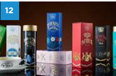
TWG Tea Boutique