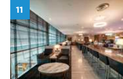
Changi Airport SATS Premium Lounge