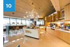
Changi Airport Ambassador Transit Lounge