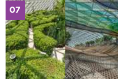
Jewel Changi Airport