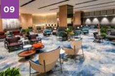
Changi Airport Group