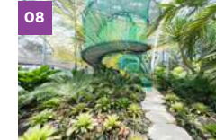
Jewel Changi Airport