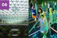
Jewel Changi Airport Jewel Changi Airport Devt